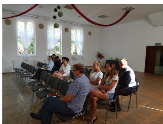
Gmina Jabłonowo Pomorskie