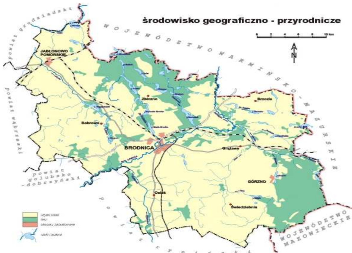
Mapa nr 2 Środowisko geograficzno – przyrodnicze.

inicjatywy i staraniem Polskiego Towarzystwa Turystyczno-Krajoznawczego, Brodnickiego i Górznięsko-Lidzbarskiego Parku Krajobrazowego oraz Nadleśnictwa Brodnica. Turystyczne szlaki piesze wyznaczono głównie na terenach parków krajobrazowych: Brodnickiego i Górznięsko-Lidzbarskiego. Do najliczniej uczęszczanych należą: szlak żółty (Toruń-Brodnica-Radomno), niebieski (Górzno-Gutowo-Bachotek), zielony (Górzno-Tama Brodzka-Łąkorz), niebieski (Brodnica-Mieliwo-Ostrowite), czerwony (Brodnica-Bobrowo-Płowężek-Łasin). Szlaki kajakowe to przede wszystkim rzeka Drwęca, na której corocznie odbywa się międzynarodowy spływ kajakowy oraz Skarlanka i Cichówka, jak również Struga Brodnicka i Brynica. Na terenie LSR wyznaczono liczne ścieżki przyrodniczo-dydaktyczne. Do najbardziej znanych należą: „Zarośle” na terenie leśnictwa Zarośle, „Bachotek” - kajakowa, „Bobrowiska” w Grzmięcy, „Grabiny- Łąkorz” w leśnictwie Grabiny, „Szumny Zdrój” w leśnictwie Górzno, „Retno” w leśnictwie Tegowiec, „Na bindugę” w leśnictwie Długi Most. Liczne jeziora oraz stawy rybne to baza rozwoju rybołówstwa oraz wędkarstwa. W miejscowości Górzno z powodzeniem rozwija się turystyka aktywna, gdzie zapaleńcy geocachingu ogłosili ją polską stolicą tej dziedziny.