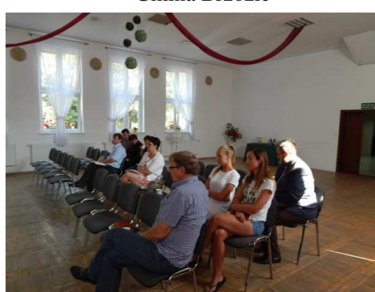
Gmina Jabłonowo Pomorskie