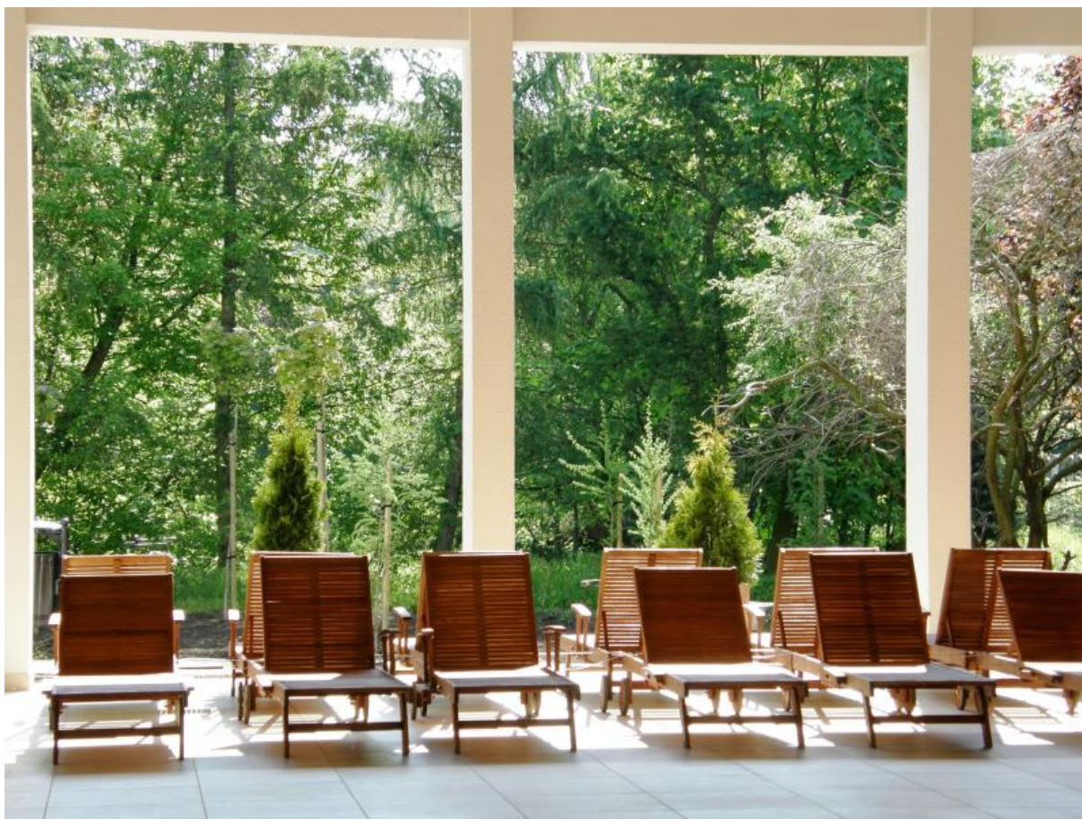
Rysunek 3. Pijalnia wód.