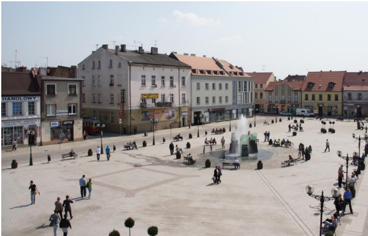
Rysunek 6. Rynek.