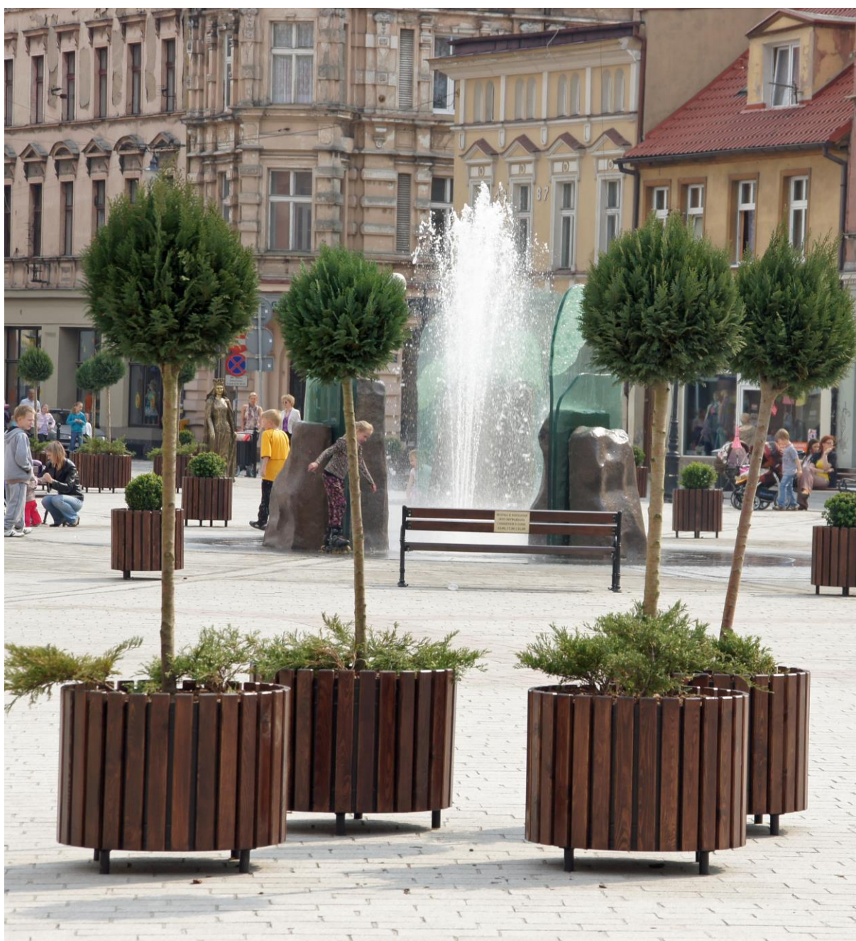
Rysunek 10. Fontanna multimedialna.