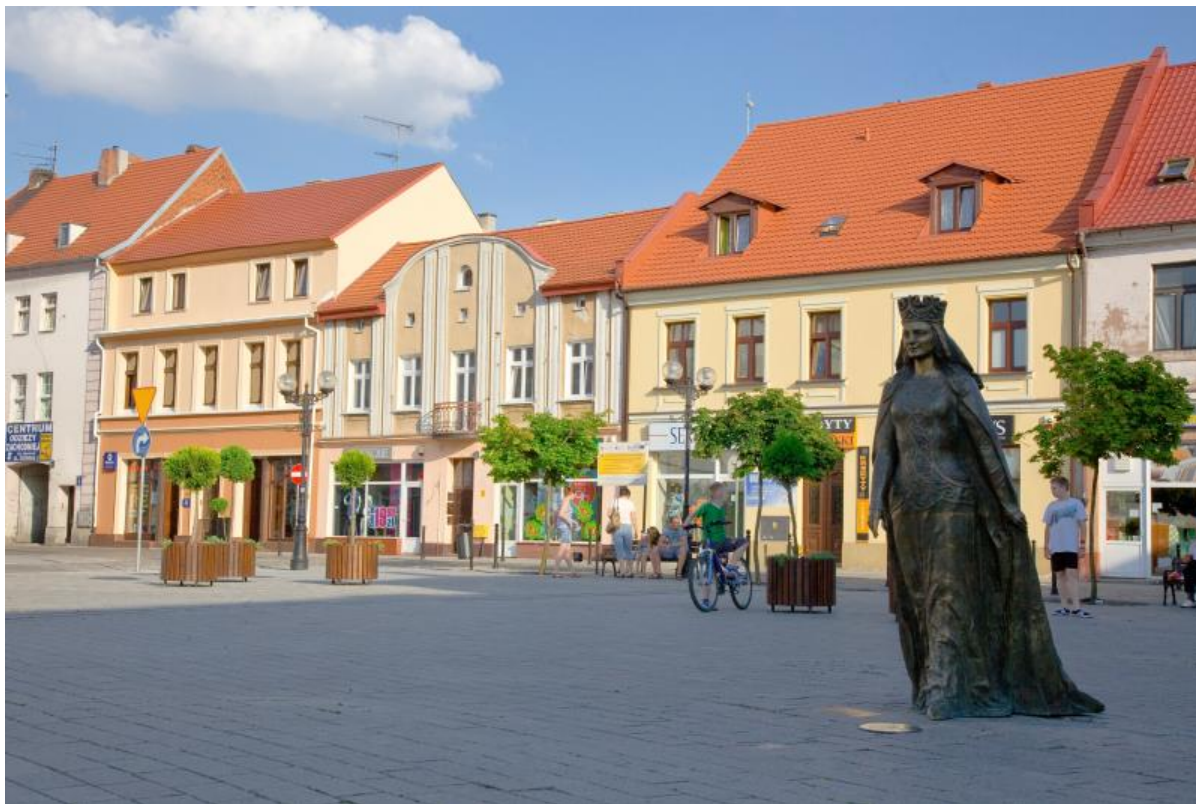
Rysunek 5. Rewitalizacja miasta.

W perspektywie finansowej 2007-2013 Miasto Inowrocław realizowało ze środków RPO WK-P działania rewitalizacyjne, które zostały uznane przez Instytucję Zarządzającą za modelowe, na tle innych tego typu działań w województwie.