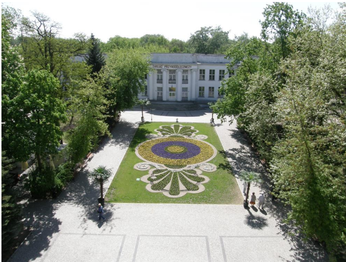
Rysunek 12. Solanki.