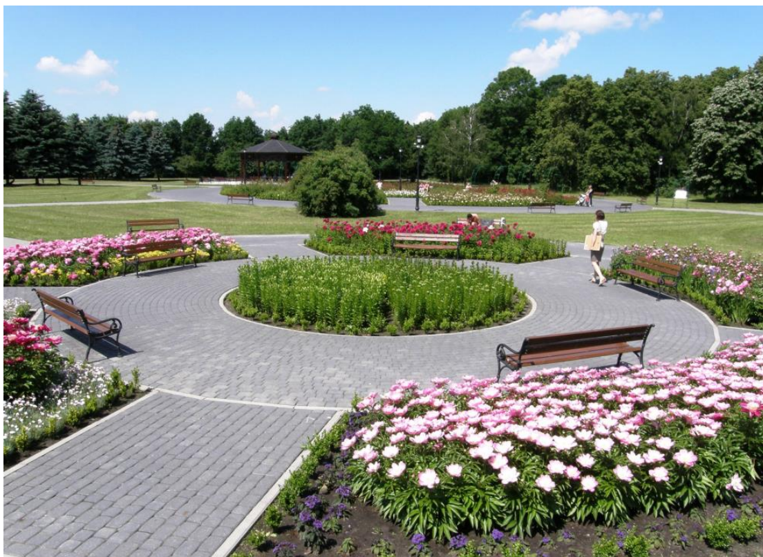
Rysunek 1. Ogrody zapachowe.

Jednym z najważniejszych założeń nowo projektowanej polityki spójności na lata 2014-2020 jest szerokie uwzględnienie w jej ramach wymiaru terytorialnego. Wynika to bezpośrednio z zapisów Traktatu Lizbońskiego , który zrównał wymiar terytorialny z wymiarem gospodarczym i społecznym. Podejście terytorialne, które powinno być jedną z podstawowych zasad programowania na lata 2014-2020, oznacza odejście od postrzegania obszarów przez pryzmat granic administracyjnych na rzecz definiowania ich na podstawie potencjałów i barier rozwoju poszczególnych terytoriów (różnej wielkości). Zintegrowane podejście terytorialne stanowi również jedną z podstawowych zasad strategicznych dokumentów krajowych: Koncepcji Przestrzennego Zagospodarowania Kraju 2030 (KPZK) oraz Krajowej Strategii Rozwoju Regionalnego 2010-2020 (KSRR) a także Umowy Partnerstwa , która stanowi podstawę realizacji dla działań wspieranych ze środków Wspólnych Ram Strategicznych (WRS), w tym w szczególności z funduszy strukturalnych w Polsce. 1