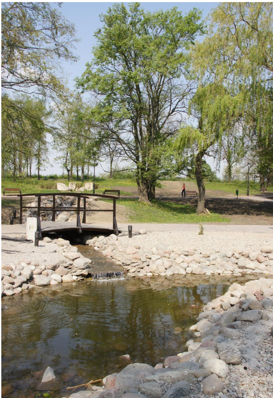
Rysunek 11. Skwer Wyczołkowskiego.