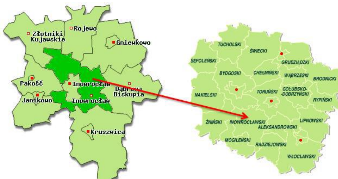
Rysunek 2. Położenie gminy Inowrocław na tle powiatu inowrocławskiego i województwa.