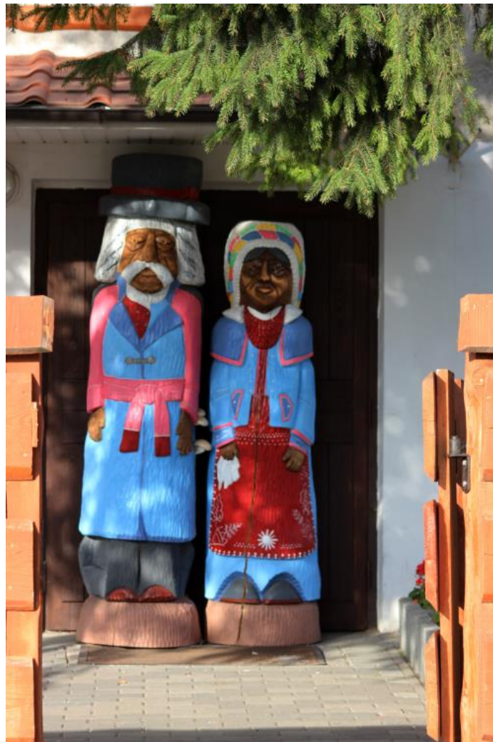
Rysunek 4. Centrum Dziedzictwa Kujaw Zachodnich.

o powierzchni 1-5 ha, które stanowią prawie 30 % wszystkich gospodarstw. Następnymi w kolejności są gospodarstwa o powierzchni 5-10 ha i 15 ha i więcej.