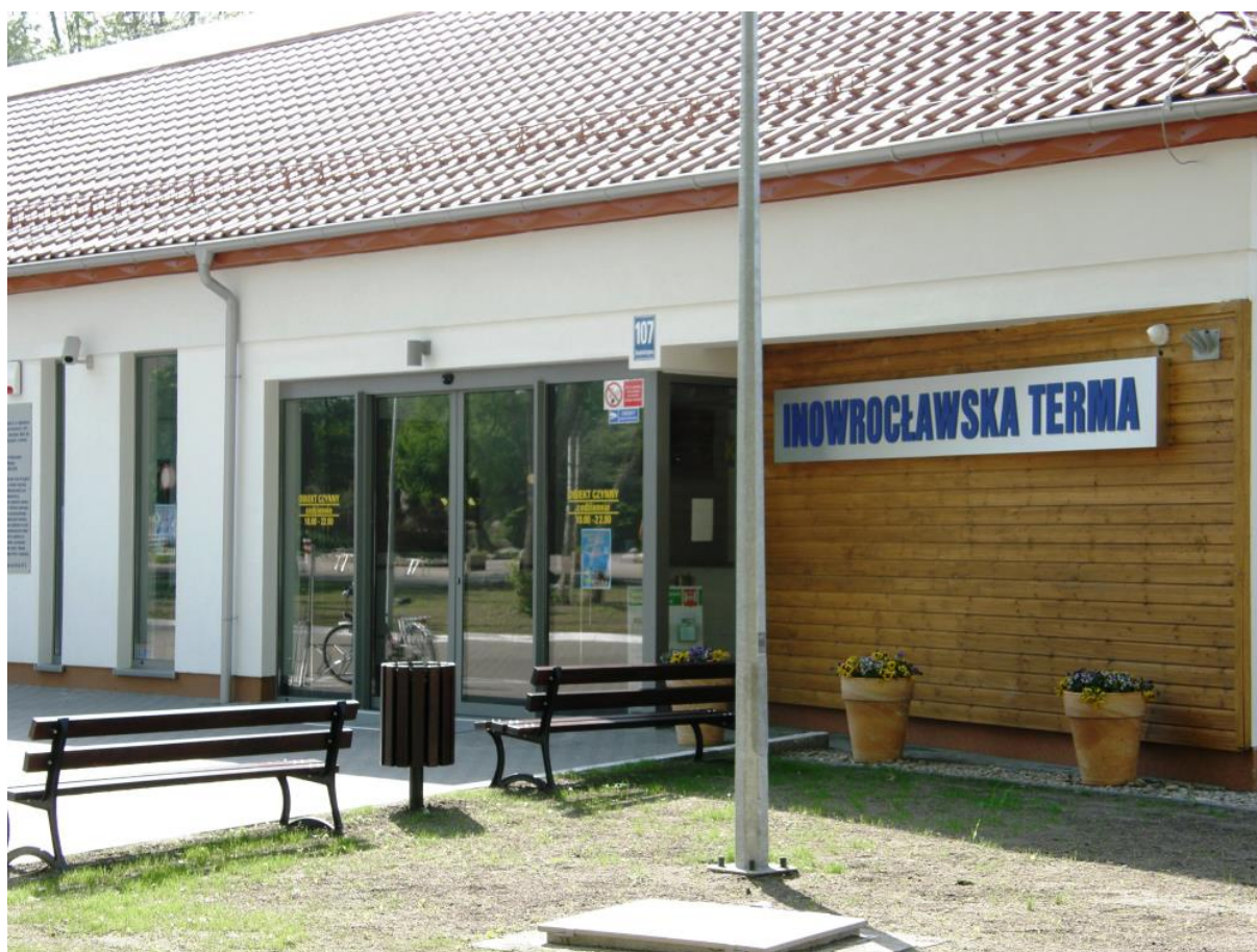
Rysunek 9. Inowrocławska Terma.