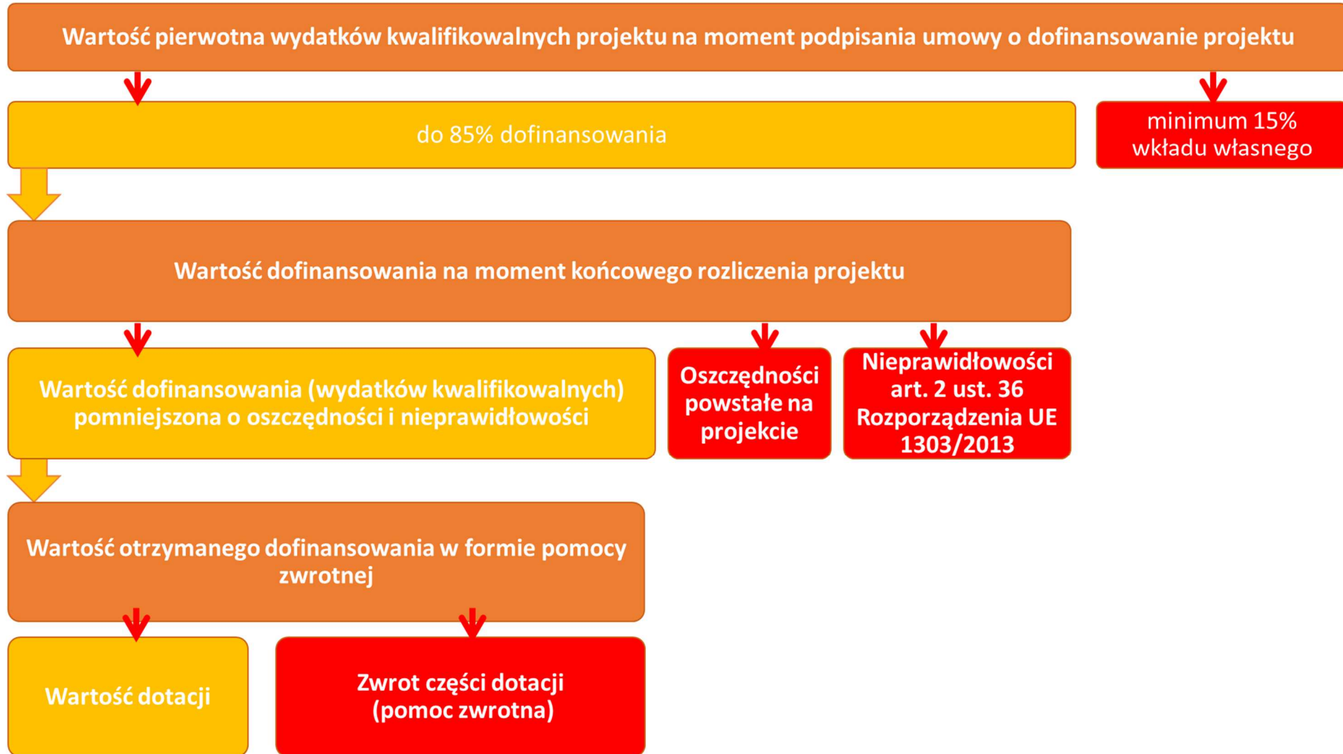
Graf: Schemat udzielanego dofinansowania w przypadku udzielenia wsparcia w formie pomocy zwrotnej