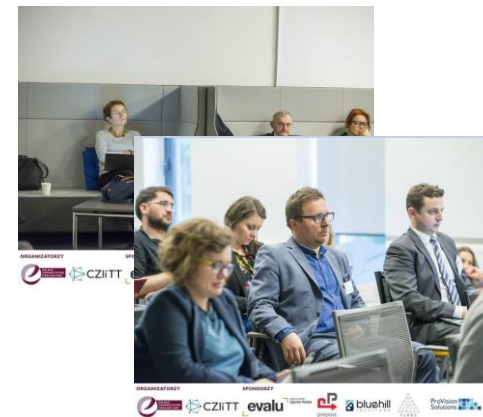
Seminarium: „Ewaluacja w kulturze”