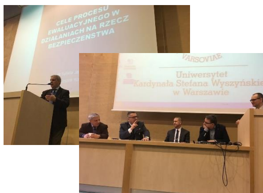
Seminarium: „Ewaluacja w sferze bezpieczeństwa”