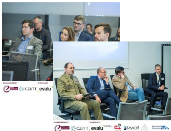
Panel: „Ewaluacja w obszarze bezpieczeństwa”